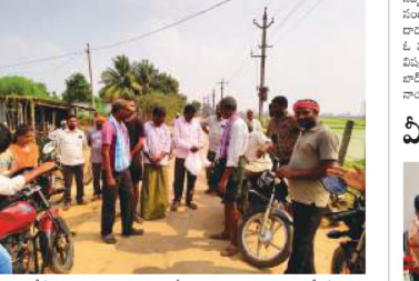
విద్యుత్ అధికారులు ఆటో స్టాటర్లను తొలగించిన విద్యుత్ అధికారులు... విద్యుత్ అధికారులు ఆటో స్టాటర్లను తొలగించిన విద్యుత్ అధికారులు...