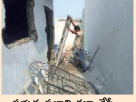
ప్రభుత్వ స్థలాన్ని కబ్బాల చేస్తే...